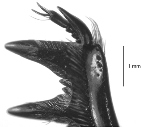
Figura 3. Vista dorsal del espolón protibial de la hembra.

Azúcar (26°08 S, 70°39'W), podrían ser relevantes para elaborar un inventario general y categorizar los futuros estados de conservación de la fauna de artrópodos, lo que contribuiría a manejar con mayor eficacia esta área silvestre.