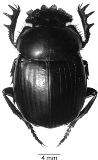
Figura 1. Vista dorsal del macho de Megathopa villosa .

Consideraciones distribucionales. Según estos nuevos registros, M. villosa se distribuye en gran parte del DCT, que corresponde a la provincia biogeográfica de Coquimbo de la Subregión Chilena Central, áreas transicionales con respecto al desierto de Atacama y a la estepa costera (Morrone 2006). Es probable que muestreos más exhaustivos realizados en sectores de difícil acceso, permitan ampliar el rango distribucional de esta especie y de otros escarabeidos. Al respecto, Jerez (2000) señala que la mayoría de la información disponible en colecciones y en la literatura corresponde a recolecciones efectuadas cerca de poblados o de la red vial, lo que en conjunto no aporta información completa del área. En este sentido, prospecciones entomológicas a realizar en la Reserva Nacional Pajón (25°05'S, 70°29'W) y en el Parque Nacional Pan de